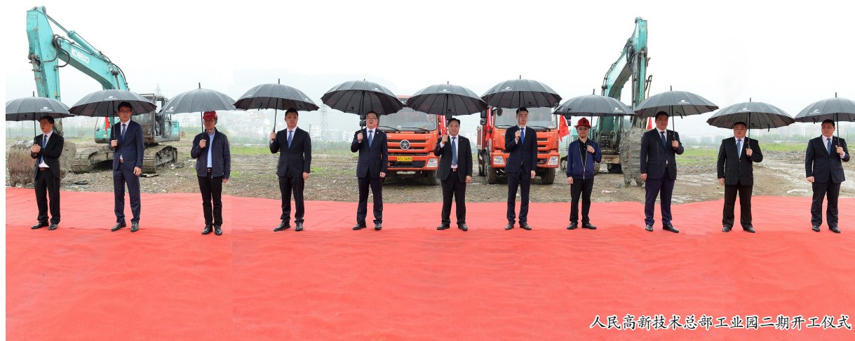
人民高新技术总部工业园二期开工仪式

本报讯 春雨润万物,人民谱新图。4月4日上午,伴随着贵如油的沥沥春雨,人民高新技术总部工业园二期项目开工仪式在柳市湖横隆重举行。