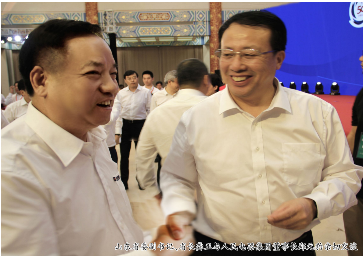
山东省委书记、省长龚正与人民电器集团董事长郑元豹亲切交谈

本报讯 8月24日，“2017中国民营企业500强发布暨民营经济发展峰会”在济南举行，集团董事长郑元豹应邀到会，并参加相关重要活动。