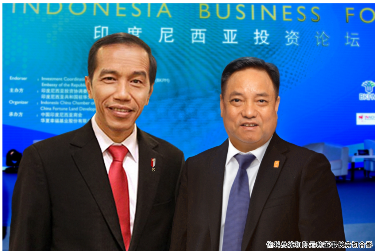
佐科总统和郑元豹董事长亲切合影

本报讯 9月3日,印度尼西亚投资论坛在上海隆重举行,印尼总统佐科、中国人民电器集团董事长郑元豹等众多政界、工商界重要人士出席。在论坛上,佐科高度评价了中国的发展成就。负责招商引资的印尼部长补充说,这几年印尼经济刚刚开始发展,有点像十几年前的中国。比如说印尼停电频繁,就是因为电力设施基础薄弱。