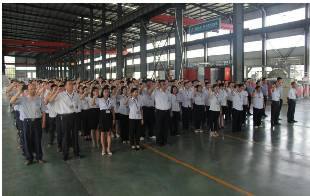
江西人民电力集团举行“8.18 质量日”活动