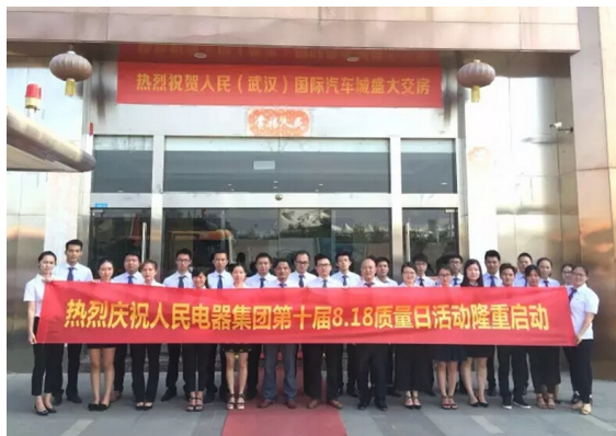
人民(武汉)国际汽车城举行“8.18 质量日”活动