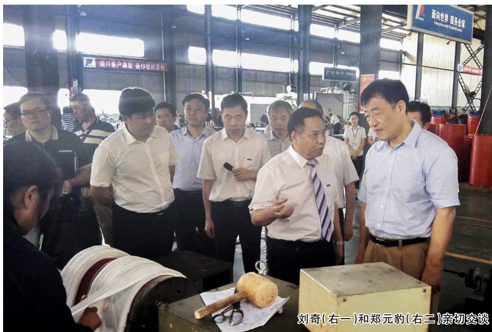
刘奇(右一)和郑元豹(右二)亲切交谈

本报讯 7月27日下午,江西省委副书记、省长刘奇莅临人民电器集团抚州生产基地考察调研。省委省政府相关部门负责人,抚州市委书记肖毅,市委副书记、市长张鸿星,市政府秘书长喻大荣,崇仁县委书记方百春,县委副书记、县长程新飞等领导陪同考察调研。人民电器集团董事长郑元豹、江西人民电力集团董事长包巨文等隆重接待刘奇一行。集团董事长郑元豹向刘奇汇报了企业创新、品牌战略、智能发展等情况。刘奇高度评价人民电器集团在振兴中国制造、打响民族品牌历程中的积极作用,并勉励企业创新发展,做